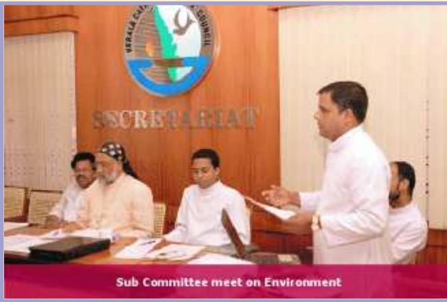
Sub Committee meet on Environment

യ്ക്കെതിരെയുള്ള അധികക്ഷേപങ്ങളെ പ്രതിരോധിക്കുക മാത്രമല്ല, സഭാവിശ്വാസികളുടെ ജീവിതത്തെ കൂടുതൽ സർഗാത്മകവും സാമൂഹിക ഉത്തരവാദിത്വമുള്ളതുമാക്കുന്നതാണെന്ന തിരിച്ചറിവുമാണ്. ക്രൈസ്തവസഭയുടെ വിദ്യാഭ്യാസസ്ഥാപനങ്ങളെ തകർക്കുന്നതിനുള്ള നിയമ നടപടികളും പാഠ്യപദ്ധതി പരിഷ്കരണവുമായിരുന്നു സർക്കാരിന്റെ ഭാഗത്തുനിന്നുമുണ്ടായത്. 'മതമില്ലാത്ത ജീവൻ' എന്ന പാഠഭാഗവും, ക്ലസ്റ്റർ പരിശീലനത്തിനായി പുറത്തിറക്കിയ ക്രൈസ്തവ സഭയെ നിന്ദിക്കുന്ന തരത്തിലുള്ള സിഡി, കെഇആർ പരിഷ്കരണം... എന്നിങ്ങനെ നിരന്തരം വിദ്യാഭ്യാസ മേഖലയെ കലുഷിതമാക്കി നിറുത്താനുള്ള ഗൂഢശ്രമങ്ങൾ ഭരണപക്ഷത്തുനിന്നുമുണ്ടായി. ഇതിനൊപ്പം തന്നെ വിദ്യാർത്ഥി സംഘടനകളെ മുന്നിൽ നിറുത്തി സഭാസ്ഥാപനങ്ങളെ ആക്രമിക്കുന്ന പ്രവണതകൾക്കും ശക്തിയേറി. മാധ്യമങ്ങളിലൂടെ ക്രൈസ്തവസഭയെ നിരന്തരം അധികക്ഷേപിക്കുന്നതിനും ഒരു പരിധിവരെ പാർട്ടി വിജയിച്ചു. ഇതിൽ ചില മാധ്യമങ്ങൾ കൂട്ടുചേരുകയുമുണ്ടായി. ക്രൈസ്തവ സഭാസ്ഥാപനങ്ങൾക്കെതിരായി ഉണ്ടാവുന്ന ചെറിയ വീഴ്ചകൾപോലും വലിയ സംഭവങ്ങളായി അവതരിപ്പിക്കാൻ ഇത്തരം മാധ്യമങ്ങൾ ശ്രമിച്ചിട്ടുണ്ട്. നിരന്തരമായുണ്ടാകുന്ന, ആസൂത്രിതമായ ഇത്തരം അതിക്രമങ്ങളെ ഫലപ്രദമായി പ്രതിരോധിക്കാൻ ഉണർന്നുപ്രവർത്തിക്കുന്നതിന്റെ ആവശ്യകത ജാഗ്രതാസമിതിക്ക് കൂടുതൽ ബോധ്യപ്പെടുവാൻ ഇടിയടയാക്കി.