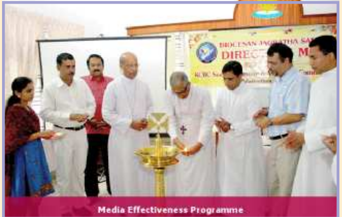
Media Effectiveness Programme

സഭയ്ക്കെതിരെയുണ്ടാകുന്ന പല ആക്ഷേപങ്ങളും ആരോപണങ്ങളും അവഗണിക്കേണ്ടവയാണെന്ന ഉത്തമബോധ്യമുണ്ട്. ജാഗ്രതാസമിതിയുടെ കാഴ്ചപ്പാടും അതുതന്നെയാണ്. യാതൊരു നീതിനിഷ്ഠയുമില്ലാത്ത വിധത്തിലാണ് പലപ്പോഴും ആക്ഷേപങ്ങൾ ഉന്നയിക്കപ്പെടുന്നത്. എന്നാലും ഇത്തരം ആക്ഷേപങ്ങളും ആരോപണങ്ങളും നിരന്തരമാവുകയും സഭ മറുപടി പറയാതിരിക്കുകയും ചെയ്യുമ്പോൾ ചില ആളുകളിലെങ്കിലും ഇത് സംശയം ജനിപ്പിക്കുന്നു. അതിനാലാണ് സഭയ്ക്കെതിരെയും സഭാസ്ഥാപനങ്ങൾക്കെതിരെയുമുള്ള നടപടികളെ എതിർക്കുന്ന മാധ്യമസമ്പർക്കപരിപാടി ആരംഭിച്ചത്. അതിനുവേണ്ടി മുപ്പതു രൂപതകളിലും ഫലപ്രദമായി പബ്ലിക് റിലേഷൻ ഡിപ്പാർട്ടുമെന്റുകൾ രൂപീകരിച്ചു. അതുവഴി രൂപതാതലത്തിലും ഫൊറോനാ തലത്തിലും ഇടവക തലത്തിലും ഓരോ സംഭവത്തിലും സഭ സ്വീകരിച്ച നിലപാടുകളും എന്തുകൊണ്ടാണ് ഇത്തരമൊരു നിലപാടിലേക്ക് സഭ എത്തിച്ചേർന്നതെന്നും വിശദീകരിച്ചുകൊടുക്കാൻ സാധിച്ചു. മാത്രവുമല്ല, പ്രാദേശികമായി സഭാവിരുദ്ധപ്രവർത്തനങ്ങളെക്കുറിച്ച് സമഗ്രമായ റിപ്പോർട്ട് ശേഖരിക്കുകയും മാധ്യമവാർത്തകളുടെ ഫയൽ സൂക്ഷിക്കുകയും ചെയ്യത്തക്കവിധം രൂപതാതല പബ്ലിക് റിലേഷൻ സജ്ജമാക്കി. അതുവഴി ഫലപ്രദമായി സമൂഹത്തിൽ ഇടപെടുന്നതിന് ജാഗ്രതാസമിതിയ്ക്കു കഴിഞ്ഞു.